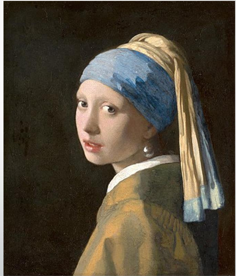
Johannes Vermeer, 1665